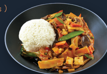
93. Tofu Veggie 15,50€