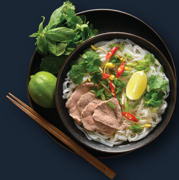
P2. Phở Bò 16,50€