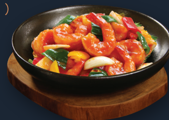
73. Mango Curry 18,90€