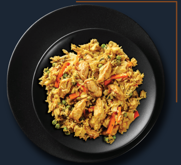
20. Gebratene Reis 15,50€