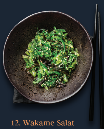
12. Wakame Salat 6,90€