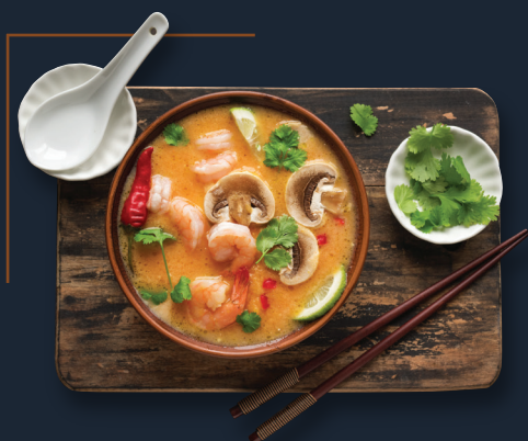
3. Cremige Kokossuppe 8,g 6,90€