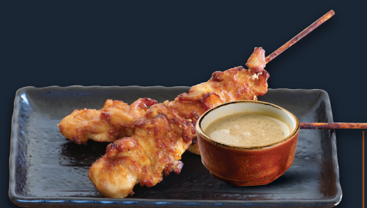
8. Sate Hähnchenspieß 7,50€