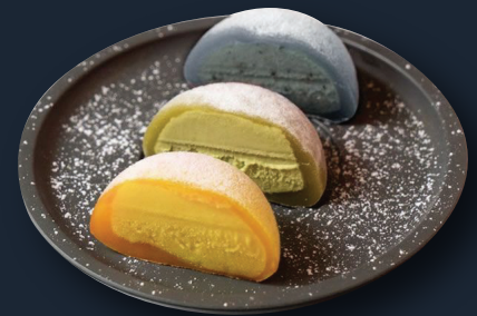
D5. Mochi Eis 8,90€