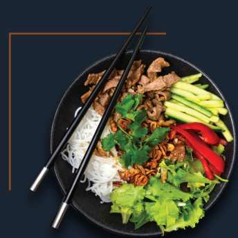
B2. Bún Trộn Bò 17,50€