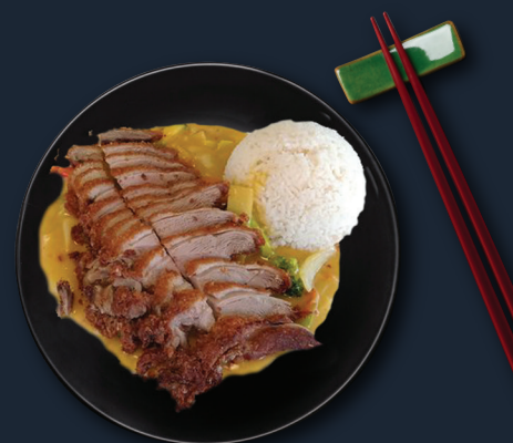
53. Mango Curry 19,90€